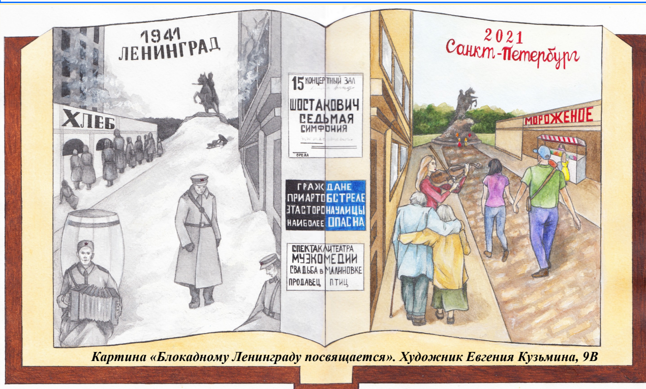
Картина «Блокадному Ленинграду посвящается». Художник Евгения Кузьмина, 9В